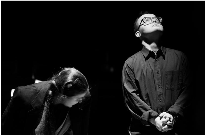
Б. Павлович «Язык птиц»