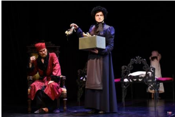
«Театр у школьной доски» Екатеринбургский ТЮЗ