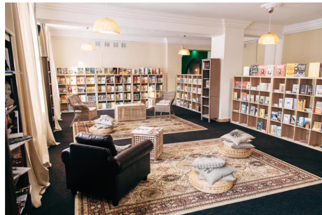
Букхолл Красноярский ТЮЗ